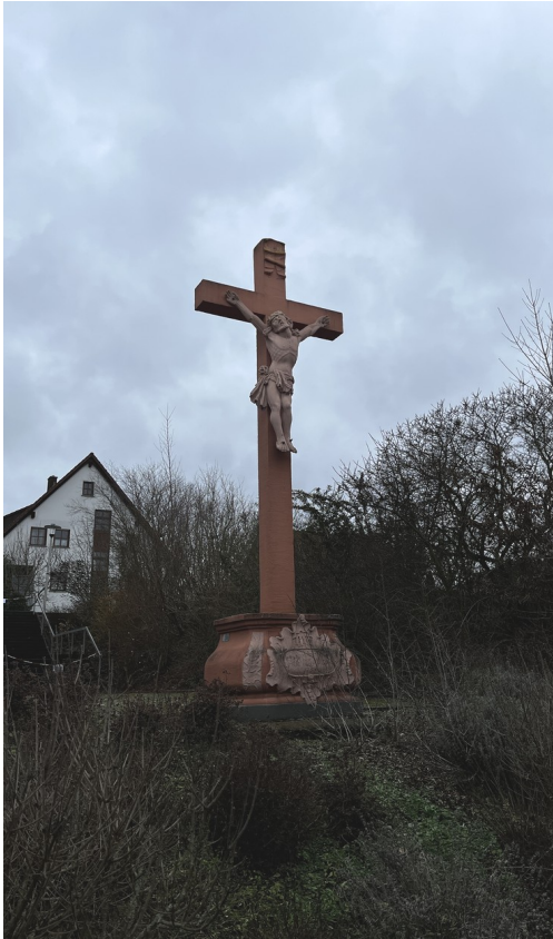
Missionskreuz in Leinach

Früh am Morgen des Karfreitags versammeln sich die Erlabrunner am Friedhof, um mit der KJG zusammen den Kreuzweg hinauf zum Käppele zu gehen. In Margetshöchheim trifft man sich in der Kirche und betrachtet dort die Stationen Jesu auf seinem letzten Weg. In Leinach und in Zell begleiten die Kinder Jesus nach Golgotha. Es ist eine alte Gebetsform gerade in der Fastenzeit, den Weg Jesu mitzugehen. Vielleicht ist es sogar mehr als ein Gebet.